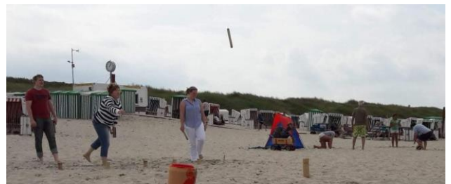
Im letzten Jahr führte uns die Inseltour auf die kleinste Ostfriesische Insel, Baltrum. Es war ein relativ frischer Tag in dem „Jahrhundertsommer“, den wir aber trotzdem mit Strandspielen und einem Bad in der Nordsee nutzen konnten.