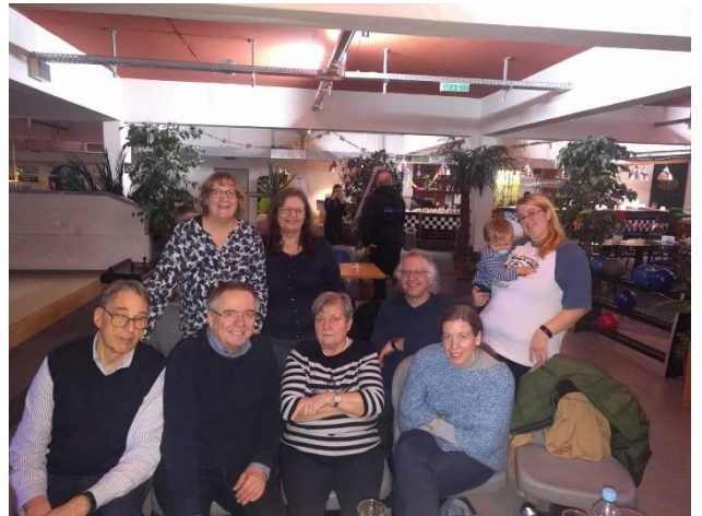
Sportlicher Jahresauftakt auf der Bowlingbahn

Also schon mal vormerken: Neujahrsbowling 2020 am 4. Januar!