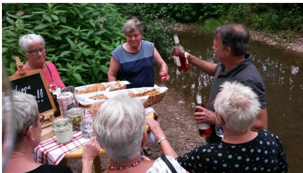
Eine Gruppe von Vereinsmitgliedern fuhr im Juli zu einem Weinwochenende an die Nahe.