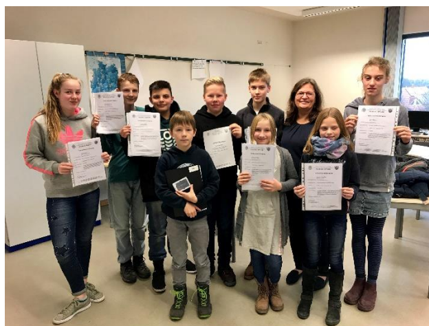
Teilnehmerinnen und Teilnehmer des Tastschreibkurses im 2. Halbjahr 2018.